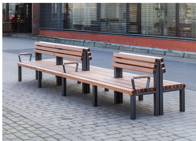
Aufstellbeispiel einer Reihen-Doppelbank

Die Bankserie basiert auf einem modularen System, bei dem sie in einem Raster von ca 1,30m Bänke mit oder ohne Rückenlehne sowie mit oder ohne Armlehne aneinanderreihen. Wünschen Sie, dass rückseitig eine zweite Reihe, also eine doppelseitige Sitzbank entstehen soll, geben Sie dieses bitte einfach im Rahmen Ihrer Anfrage an.